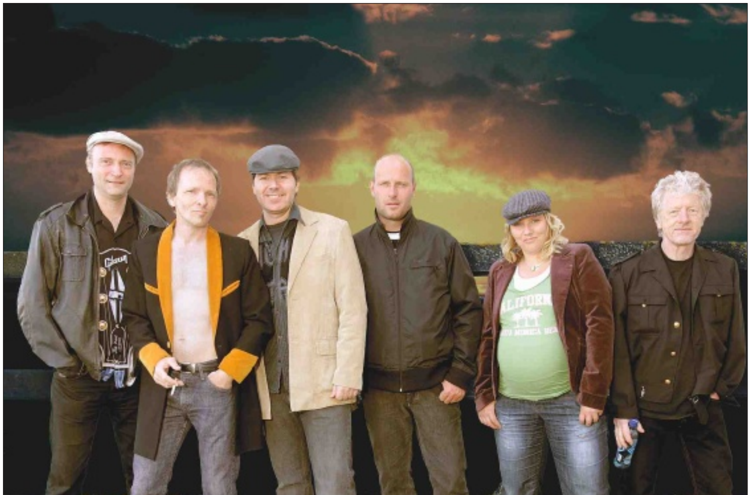
SPILLER GASOLIN: FullGas skal gjenskape stemningen fra den legendariske konserten Gasolin hadde i Kuppelhallen i Stavanger for 30 år siden.

– En kollega av meg så annonsen. Siden jeg er dansk, tenkte jeg dette kunne være en